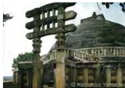
La Gran Estupa de Sanchi, India, obra del emperador budista Ashoka en el siglo III a. e. c.

La Soka Gakkai, movimiento de base ciudadana con 12 millones de miembros en 192 países y territorios, trabaja para difundir en el mundo actual el mensaje de empoderamiento del budismo Nichiren y del Sutra del loto .