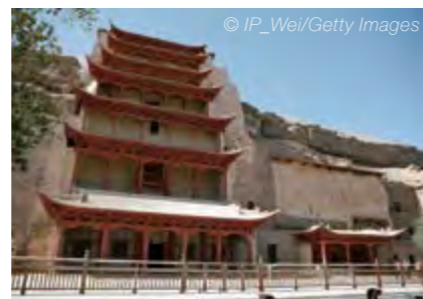
Dunhuang, hito de la Ruta de la Seda situado en la China occidental, alberga cientos de cavernas con estatuas y obras de arte budista del período temprano.