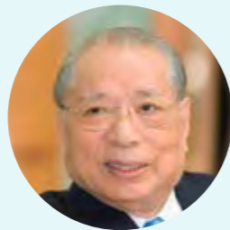
El tercer presidente DAISAKU IKEDA www.daisakuikeda.org

junto con su maestro durante la guerra. Al recuperar la libertad, reconstruyó la organización y dedicó el resto de su vida a incrementar su membresía, que en momentos de su muerte superaba las 750 000 familias en el Japón. Toda fue un fervoroso opositor a la guerra; su «Proclama para la abolición de las armas nucleares», de 1957, se considera el punto de partida del movimiento pacifista de la Soka Gakkai.