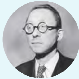
El segundo presidente JOSEI TODA www.joseitoda.org

Tsunesaburo Makiguchi (1871–1944) fundó la Soka Gakkai el 18 de noviembre de 1930, junto con su discípulo Josei Toda, y fue su primer presidente.* Educador y filósofo, Makiguchi fue encarcelado durante la segunda guerra mundial por oponerse a las políticas del gobierno militarista japonés, y falleció en prisión.