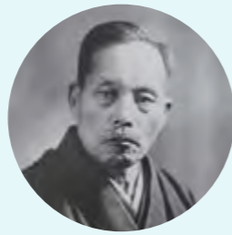
El primer presidente TSUNESABURO MAKIGUCHI www.tmakiguchi.org

* La Soka Kyoiku Gakkai (literalmente, Asociación pedagógica para la creación de valores) fue precursora de la actual Soka Gakkai (Asociación para la creación de valores).